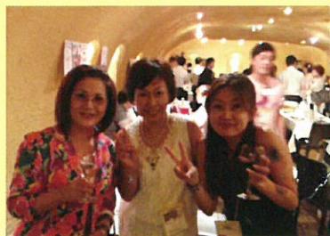
お酒ありのフランクな展示会♪