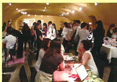
セレクトな空間でゆったりとした商談