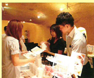
メーカーさんによる商品説明